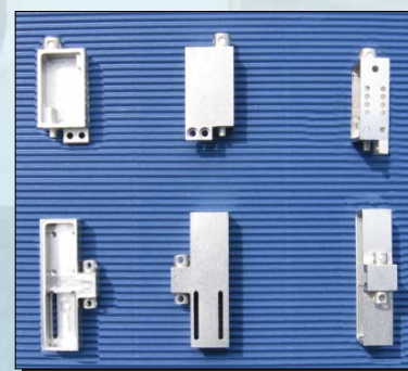
M.I.M. New Technology