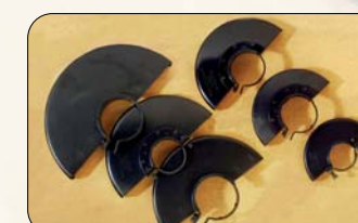
Metal + Soldado