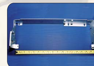
Largo 1.2 Metros