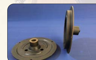
Metal + Goma