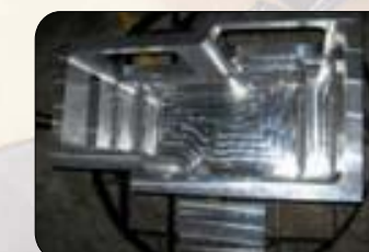
Tamaño: 900(H) X 500(D) X 600(W)